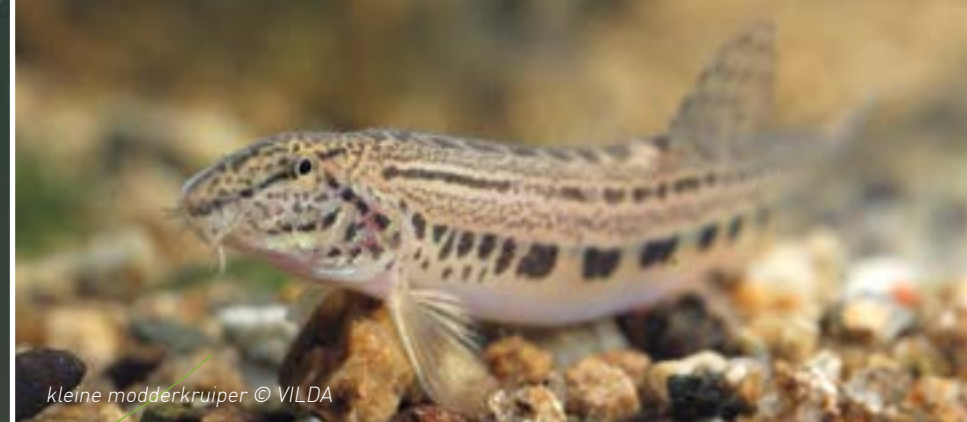
kleine modderkruiper